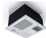
แขวนใต้เพดาน

Prefilter เป็นแผ่นกรองฝุ่นหยาบทำจากอลูมิเนียม (Aluminum Prefilter) ที่สามารถถอดล้างทำความสะอาดได้